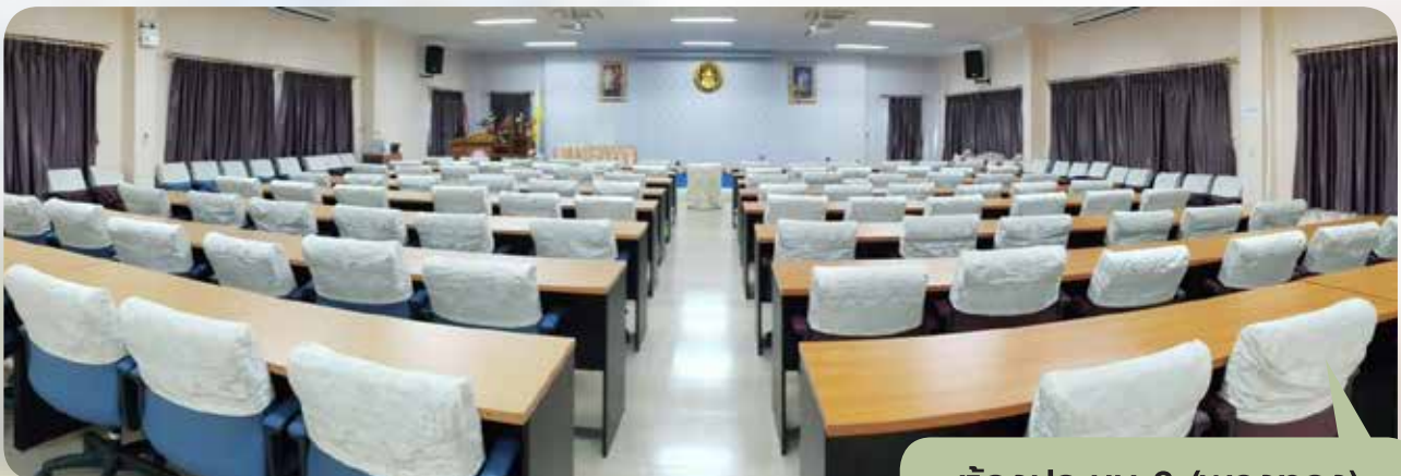
ห้องประชุม 3 (พวงทอง)