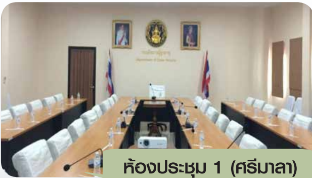
ห้องประชุม 1 (ศรียมาลา)