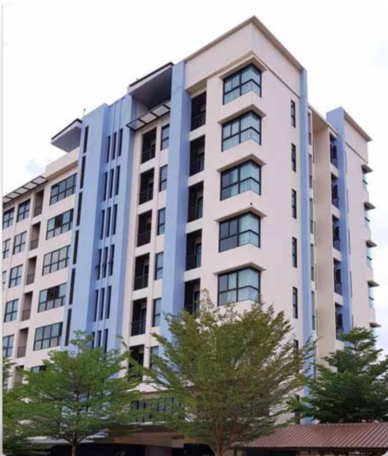
2. อาคารที่พักสำหรับ ผู้เข้ารับอบรมสัมมนา (8 ชั้น)