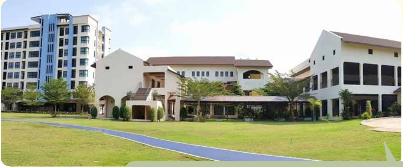
3. ส่วนการพักผ่อน (3 ชั้น)