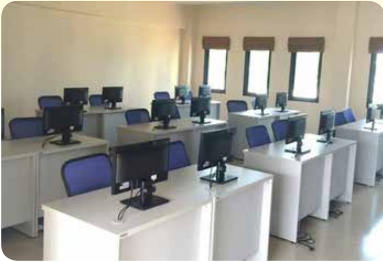
ห้องคอมพิวเตอร์ 20 ที่นั่ง (ดาวเรือง)