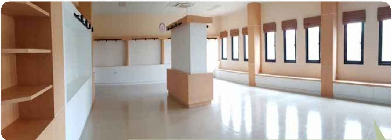
ห้องนิทรรศการ (เฟื่องฟ้า)