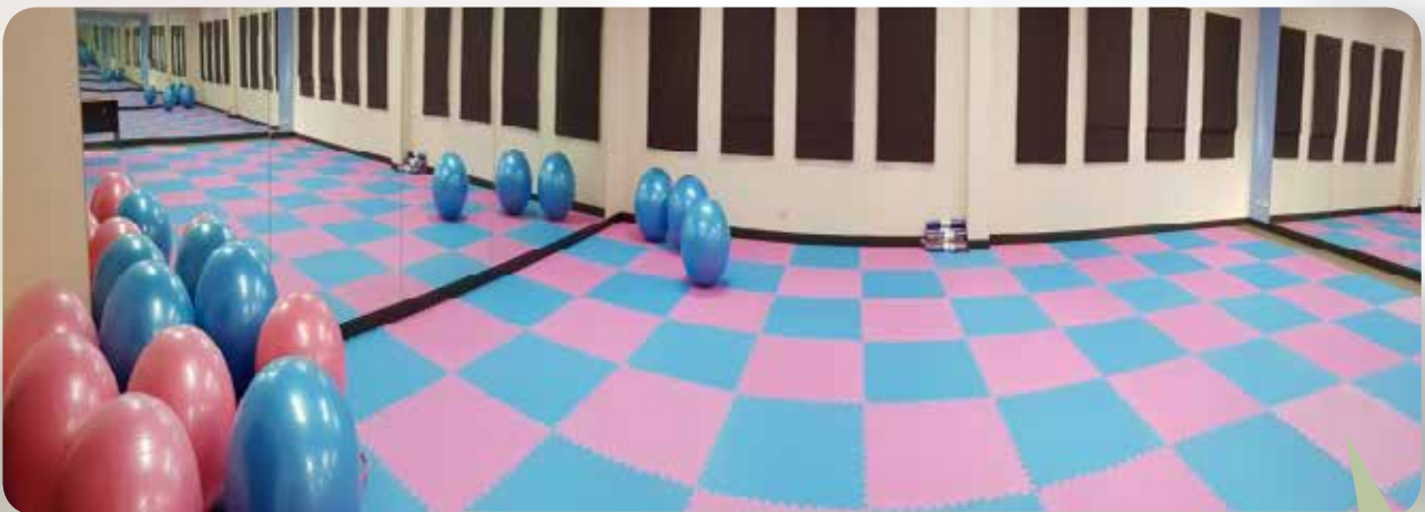
ห้องสุขภาพ (กาหลง)