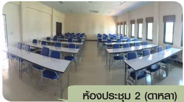
ห้องประชุม 2 (ตาสกล)