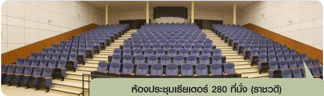
ห้องประชุมเธียเตอร์ 280 ที่นั่ง (ราชวटी)