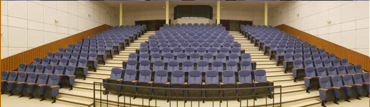
ห้องประชุมเธียเตอร์ 300 ที่นั่ง (ราชวดี)