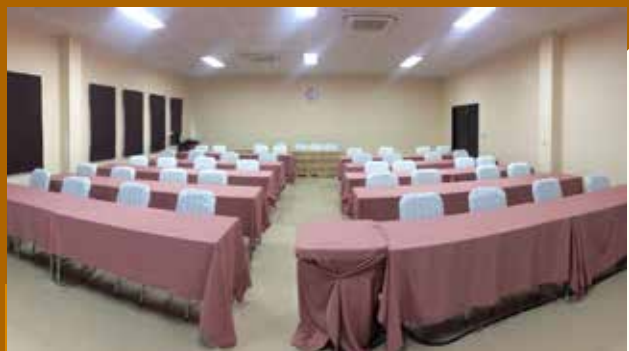
ห้องประชุม 2 (ดาหลา)