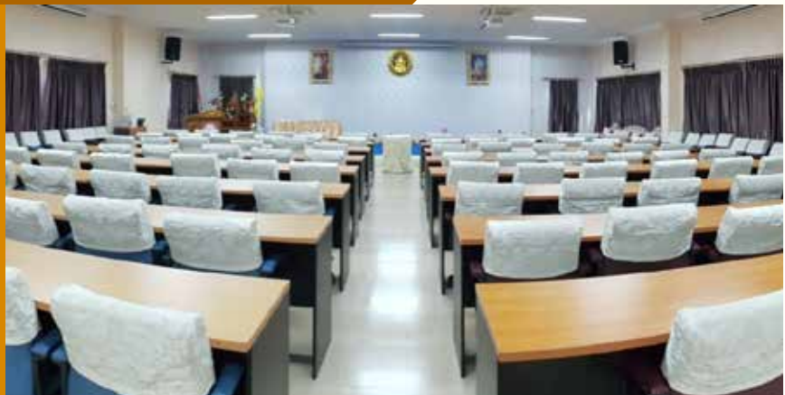
ห้องประชุม 3 (พวงทอง)