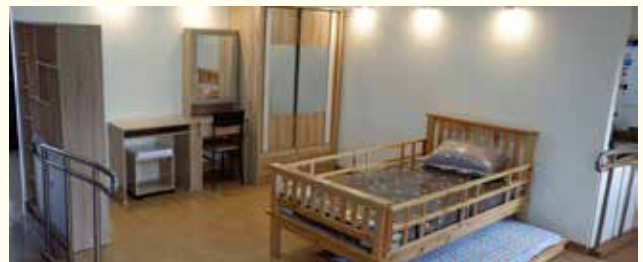
ห้องนวัตกรรม UD ผู้สูงอายุ (เฟื่องฟ้า)