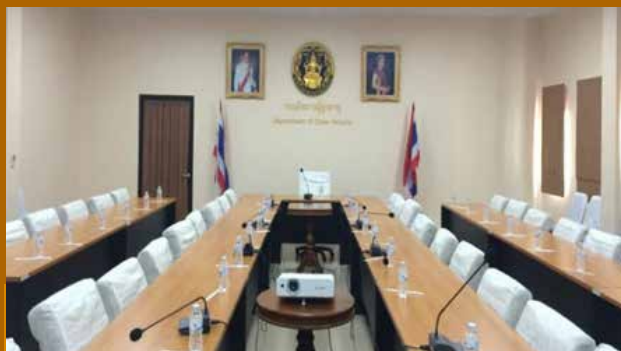
ห้องประชุม 1 (ศรีมาลา)