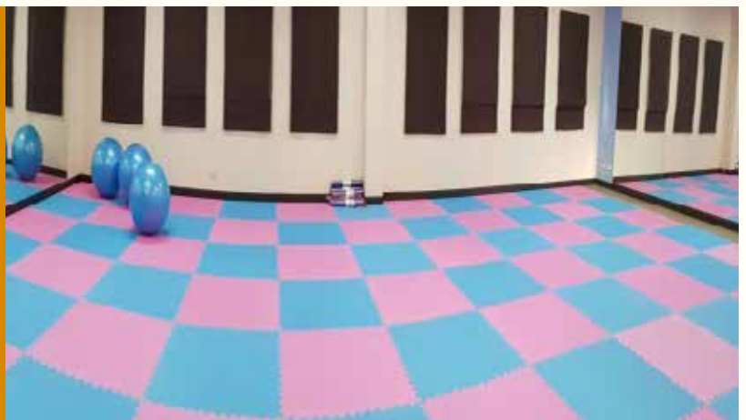
ห้องสุขภาพ (กาหลง)