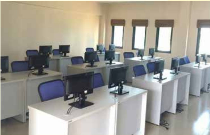
ห้องคอมพิวเตอร์ 20 ที่นั่ง (ดาวเรือง)